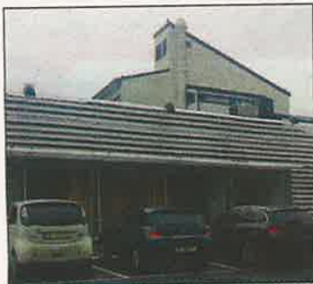
BURGER-STOPP: Gamle Scandic hotell på Ramstadsletta blir ikke McDonald's.